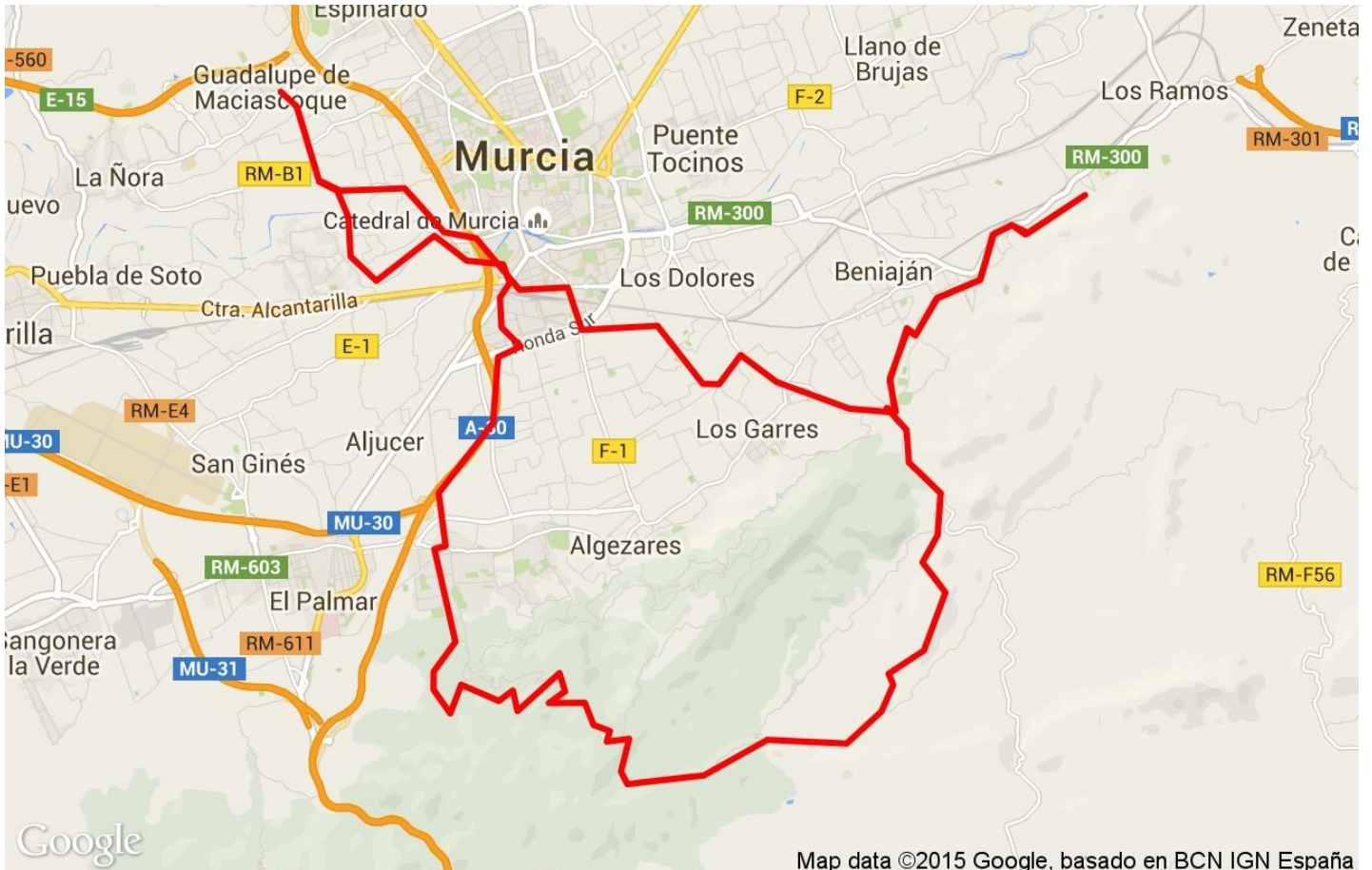
Map data ©2015 Google, basado en BCN IGN España